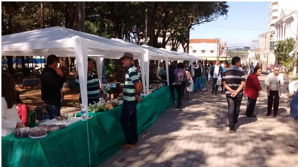
Figura 3. Feira da Agricultura Familiar (2017)

A feira tem como objetivo reunir todos os produtores que almejam comercializar os produtos hortifrutigranjeiros, conservas, doces, produtos derivados do leite e da industrialização artesanal, artigos oriundos do artesanato, cultura e lazer e outros gêneros alimentícios (JORNAL A CIDADE, 2017).